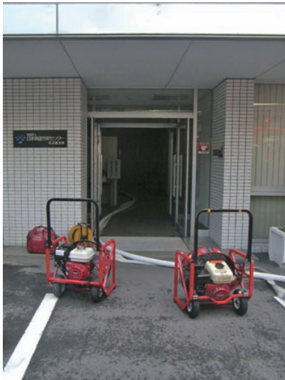
玄関（給気）側に設置した加圧排煙機 その2

加圧排煙戦術 ① 加圧排煙機を操作する隊及び統制する隊の指定 ② 進入隊、警戒隊を位置付ける ※良好な排熱・排煙が確認できない場合は、加圧排煙活動を中止する。