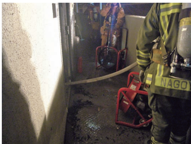
玄関（給気）側に設置した加圧排煙機 その1

この活動要領では、加圧排煙戦術を耐火建築物火災における消防活動の基本とされる「一方向戦術」に付随し